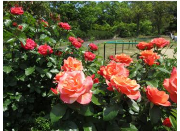
5月中旬 中央緑地のバラ

ふれあい教室の活動をとおして、みなさんが一歩ずつ自分の歩を進めていけるよう私達スタッフ一同、共に考えながら応援していきたいとおもっています。