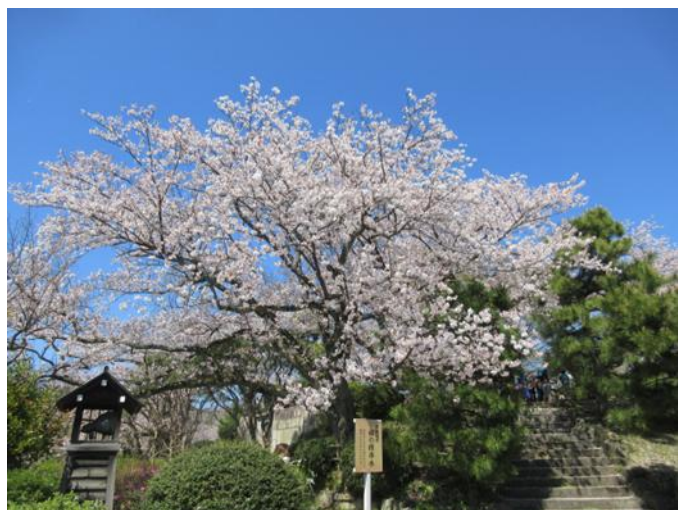
4月8日 芦城公園 満開の標準木

満開の桜とともに、ふれあい教室も 新年度がスタートしました。今年度もふれ あい教室は、皆さんにとって安心安全で 気持ちよく過ごせる居場所でありたいと 願っています。皆さんが心のエネルギー を蓄え、それぞれの一歩を踏み出せるよ う寄り添っていきたいと思います。どうぞ よろしくお願いいたします。