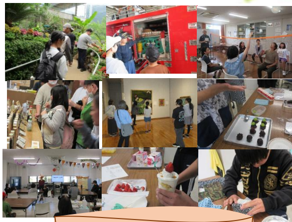
R7年度ふれあい教室 アルバム

早いもので令和7年度がまもなく終わろうと しています。この一年間を振り返ってみると、ふ れあい教室でも色々なことがありました。多く の通室生たちは、ふれあい教室の活動をおし て様々な経験を積んだり、人とふれあうことの良 さを感じたりすることができたのではないかと 思います。皆さんが4月からそれぞれの道でよい スタートを切れるように、ふれあい教室スタッ フ一同、心から応援しています。