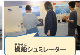
そうせん 操船シュミレーター

あたう きょうしつ 新しいふれあい教室にはIH クッキングヒ ーターが設置され、揚げ物調理を安全に行う かんきょう ととの 環境が整いました。そこで、今回の調理実習 はハロウィンシーズンということもあり、かぼ ちゃのドーナツに挑戦しました。電子レンジ かねつ でんし で加熱したかぼちゃにバター・砂糖・卵・ こむぎに ま あ 小麦粉を混ぜ合わせていきました。合わせた き じ まる だんご 生地をみんなで丸めて団子にしました。そし て、3グループ交代で揚げていきました。揚げ たてのドーナツに粉糖をまぶし熱いうちに美 い いた 味しく頂きました。