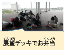
てんぼう べんとう 展望デッキでお弁当