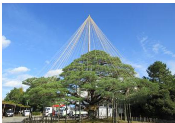
11月中旬 青空をバックに放射状に広がる雪吊り

今年も残すところあとひと月となりました。 明日につながる今日一日を大切に過ごしてい きましょう。