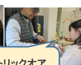
トリックオア トリート