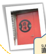
なおげんしょうゆ 直源醤油

あき しょうがいかつどう えんそく かなざわし なおげんしょうゆ かなざわ 秋の所外活動（遠足）で金沢市の直源醤油と金沢クルーズターミナルへ行ってきました。 なおげんしょうゆ かなざわしおのまち なおげんしょうゆ れきし えいぞう み いただ 直源醤油では、金沢市大野町や直源醤油の歴史についての映像を見せて頂きました。そして、 しょうゆ しゅるい つく かた はなし うかが あと ばしょ いどう じっさい はんばい 醤油の種類や作り方などのお話を伺いました。その後、場所を移動して実際に販売している しょうゆ しょうひん しょうかい いただ あじみ しゅんぎく 醤油やドレッシングなどの商品を紹介して頂き、味見もさせてもらいました。みんな春菊 か が やさい きんじそう つく いろあざ しなつづみ う つぎ や加賀野菜の金時草などから作った色鮮やかなドレッシングに舌鼓を打っていました。次に、 なおげんしょうゆ ふん かなざわ む しんばい あめ 直源醤油からバスで5分ほどの金沢クルーズターミナルへ向かいました。心配していた雨にさ ほど降られることなく展望デッキでお弁当を食べました。昼食の後は、施設内にある金沢 こうまな たいけん そうせん たの 港学び体験ルームで操船シュミレーターやクイズを楽しみました。