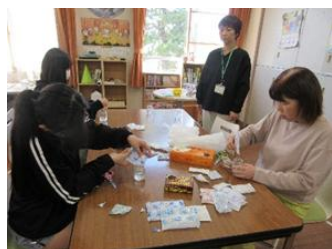
ローズマリーやラベンダーなどの香り