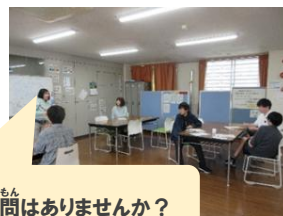
何か質問はありませんか？