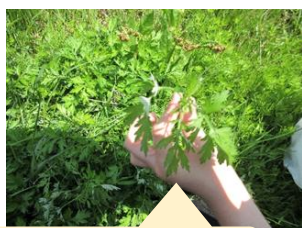
新芽をえりすぐりつみました