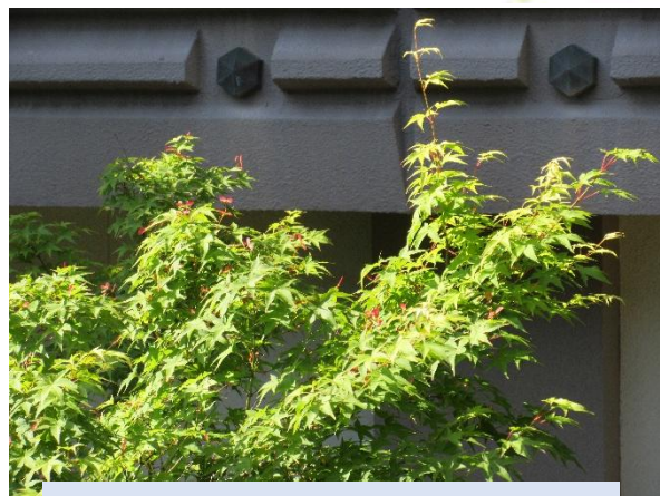
ふれあい教室の窓から見えるモミジ。新緑の中にピンク色のモミジの花を見つけました

ふれあい教室の活動をとおして、みなさんが一歩ずつ自分の歩を進めていけるよう私達スタッフ一同、共に考えながら応援していきたいとおもっています。