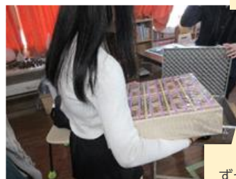
ずっしり重い一億円