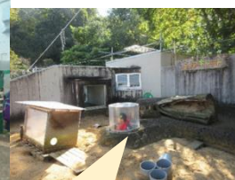
プレーリードッグ になってみたよ