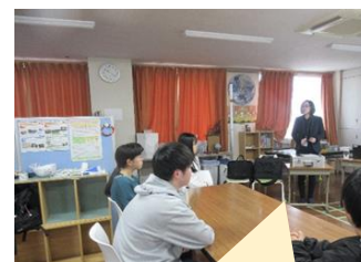
税金とはみんなが安心して暮らすための会費です。