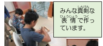
みんな真剣な表情で作っています。

この日は11月としては少し暑いと感じるほどでしたが最高の遠足日和で、青空の下、作った竹とんぼを飛ばしたり、お弁当を食べながら通室生同士交流を深めたりしていました。中には汗だくになりながら芝生を駆け回りサッカーをしていた人もおり、それぞれ秋の所外活動を楽しむことができました。