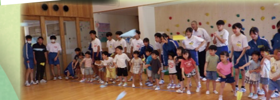
こども園保育体験