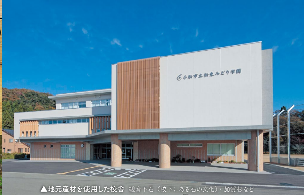
▲地元産材を使用した校舎 観音下石（校下にある石の文化）・加賀杉など