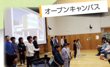
オープンキャンパス