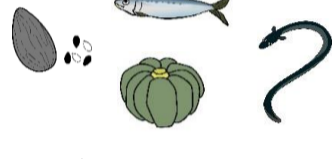
かぼちゃ、アーモンド、ごま、うなぎ、いわしなど