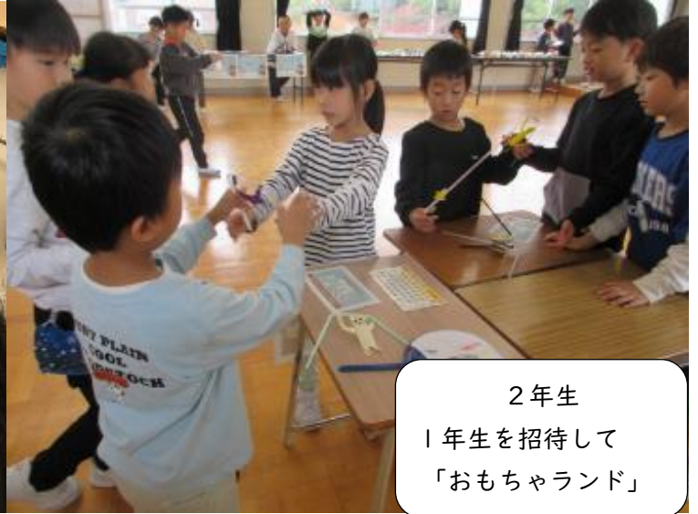
2年生 1年生を招待して 「おもちゃランド」