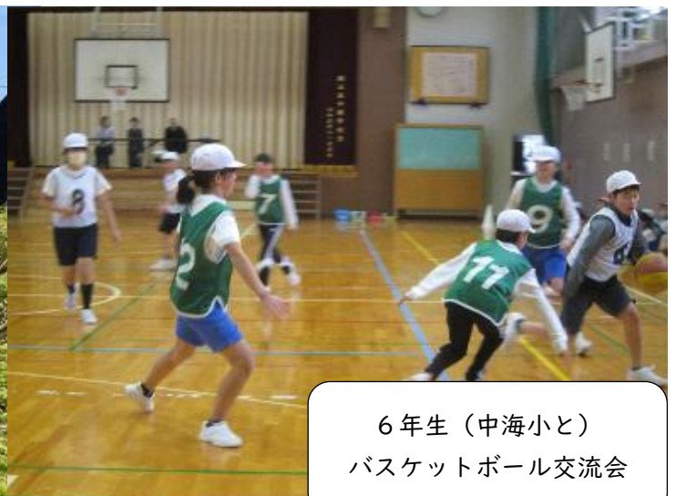
6年生（中海小と） バスケットボール交流会