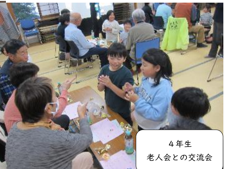
4年生 老人会との交流会