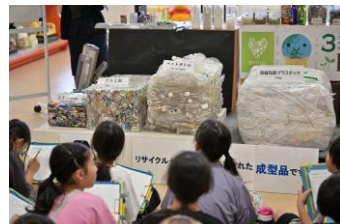
【校外学習 4年生】 エコロジーパークこまつ・ サイエンスヒルズこまつ