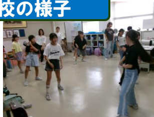
【クラブ活動 4～6年】 ダンス・なぞ解き・折り紙・パラスポーツ・パソコ ン等、様々なクラブがあります。タブレットも使い ながら、毎回みんなとても楽しそうです。