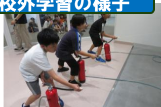
【校外学習 3年生】 埋蔵文化財センター・ 能美市防災センター