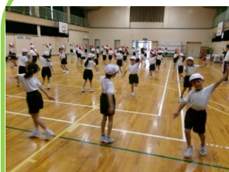
【低学年 リズム】 2年生は先に覚えて、 1年生の見本になって います。