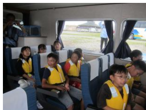
【校外学習 5年生】 金沢港湾・航空整備事務所 北國新聞白山印刷センター