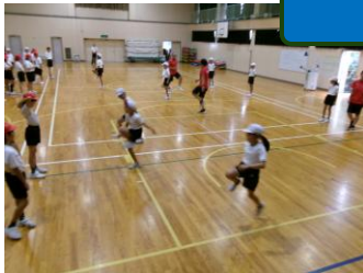
【体力向上アクションプラン 5年】 北陸体力科学研究所（ダイナミック） の方から、「走る・跳ぶ」力の向上を めざして、年間5回指導をしていただ いています。