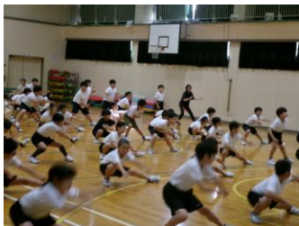
【中学年 よさこい】 4年生が3年生に、かっこよ く踊るコツを教えて、みん な上手になってきました。