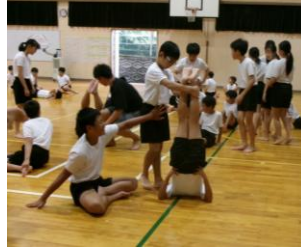
【高学年 組体操】 今年のテーマは「登竜 門」6年生も5年生を支え ながら教えています。