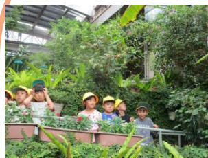
【校外学習 1年生】 ふれあい昆虫館・ 獅子ワールド