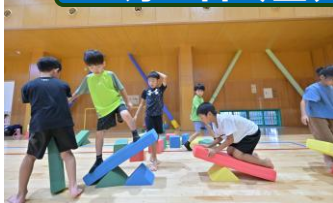
【校外学習 2年生】 いしかわ動物園・ 寺井中央児童館