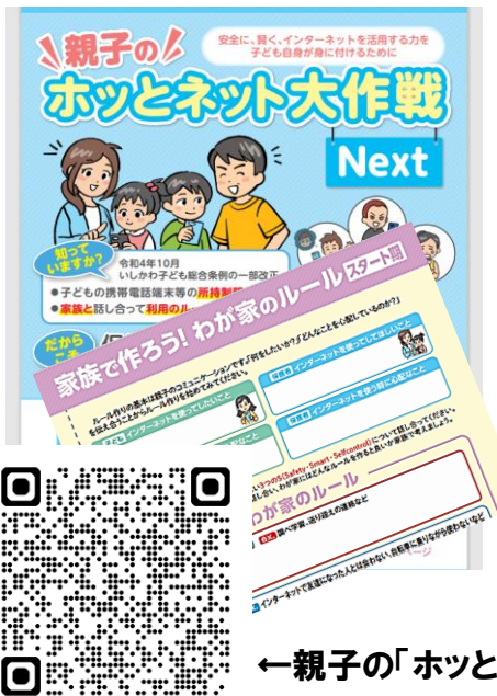
←親子の「ホッとネット大作戦」冊子QRコード

学校より配布する、石川県作成「ホッとネット大作戦」の冊子には、ネットトラブルの事例やペアレンタルコントロール（保護者による機能制限）の方法、相談窓口など、役立つ情報が多数掲載されています。ぜひご一読いただき、ご家庭でのルール作りの参考にしてください。