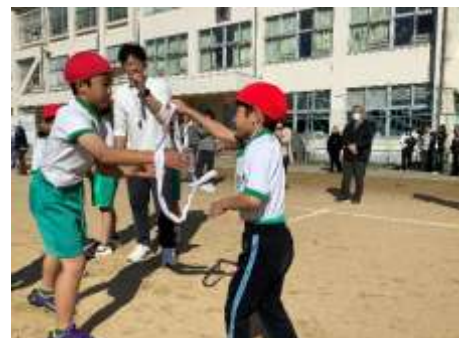
<たすきをつないで・・・タッチ！>