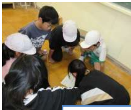
たてわりチームで走順の確認中