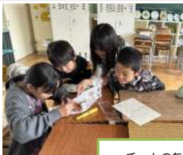
チームのたすき作り