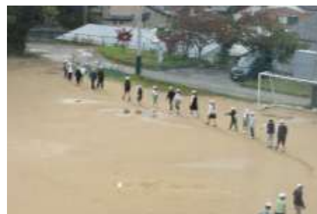
チームで歩いてコースの確認