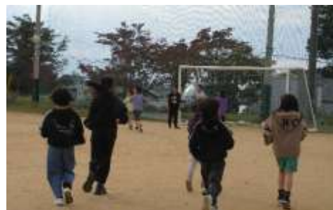
休み時間に上級生の声掛けで自主練習