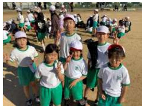
<ゴール後記念撮影★>