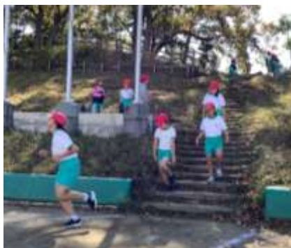
<しろやま階段を下りてグラウンドへ>