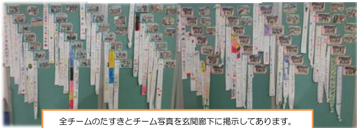
全チームのたすきとチーム写真を玄関廊下に掲示してあります。

本校で大切にしているたてわり活動。昨年度よりスタートした取組ですが、「児童が主役となる学校づくり」に向け、学校の柱としています。異学年の交流を通して「縦のつながり」を生み出すこととともに児童の主体性を伸長することを目指しています。普段の学級では見られない姿や生き生きと活動をする姿、優しく助け合う姿が見られ、子どもたちも楽しみにしている活動です。