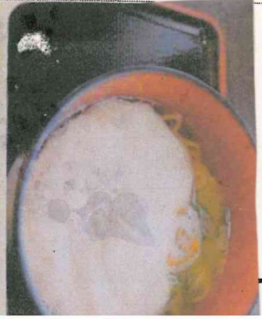
加賀丸いもとろろ子ば