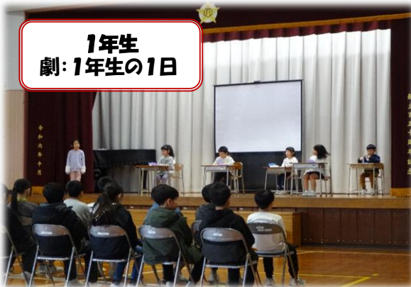
1年生 劇: 1年生の1日

縦割り活動や委員会、クラブ活動での活躍、そして運動会で下級生を引っばってくれた6年生の姿は下級生のお手本となっています。それぞれの活動の中で、下級生を思いやる気持ち、考えたことを行動に移すエネルギーを示してくれました。この後は下級生がこれを引き継いでくれると期待しています。特に、この会をよくするために企画、運営、準備を進めてくれた5年生。しっかりと進行してくれました。新たな犬丸小のリーダーとしてとても頼もしく感じました。残り少ない6年生との日々を大切に過ごしていきたいです。