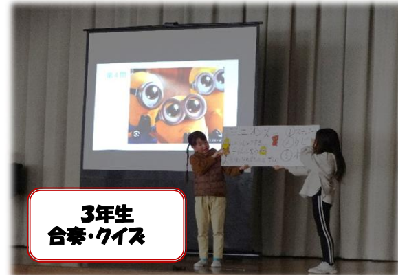
3年生 合奏・クイズ