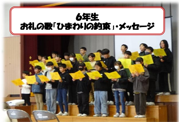
6年生 お礼の歌「ひまわりの約束」・メッセージ