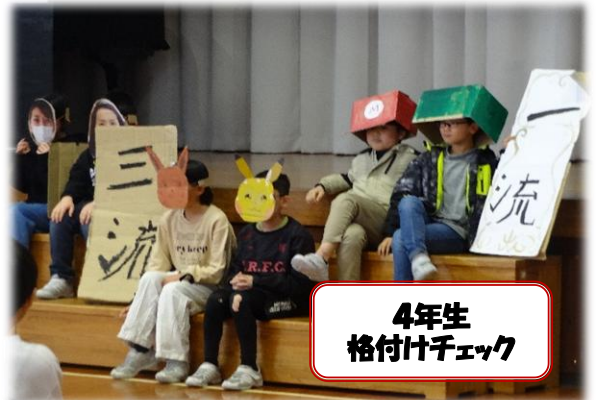
4年生 格付けチェック