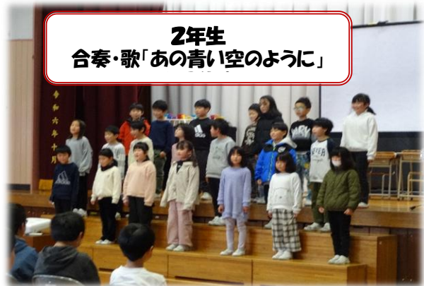
2年生 合奏・歌「あの青い空のように」