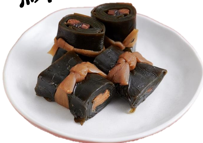
にしんの昆布巻き